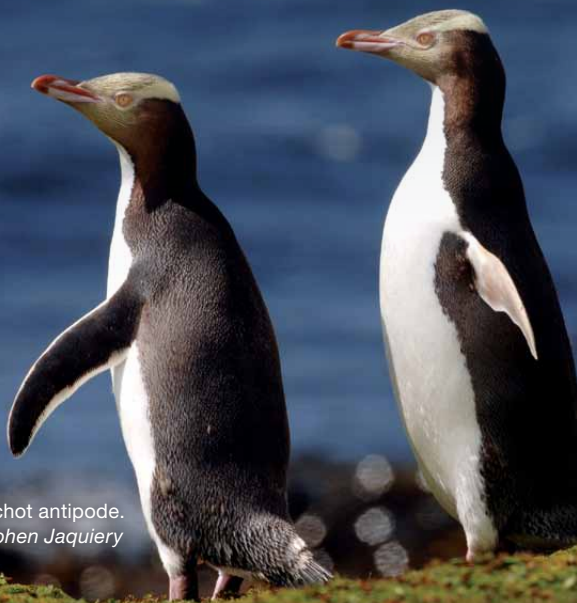
Hoiho/manchot antipode.

Chacune de ces îles jouit du niveau de protection le plus élevé, celui de réserve naturelle nationale. En 1998, elles ont de plus été inscrites au patrimoine mondial de l'humanité pour l'unicité et la diversité de leurs faune et flore sauvages.